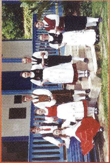
Em apresentação, de inspiração para a dança.